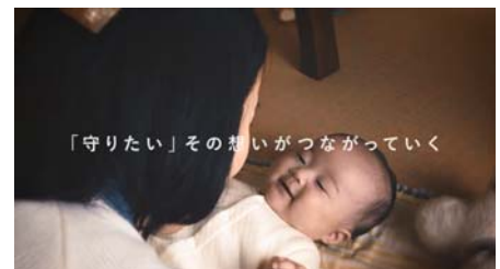
〔画像右〕動画サムネイル画像(抜粋)