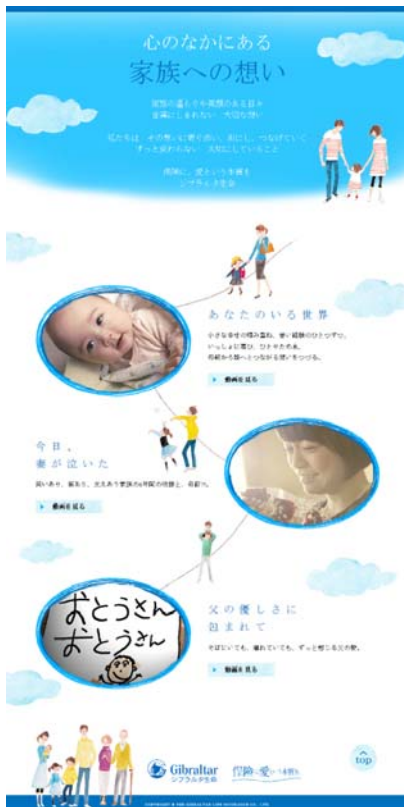
〔画像左〕スペシャルサイトTOPページ

当社公式 YouTube チャンネルでも公開していますので、ぜひご覧ください。【動画視聴時間:160秒】